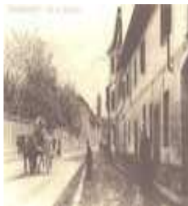
Parabiago Maggio 2010